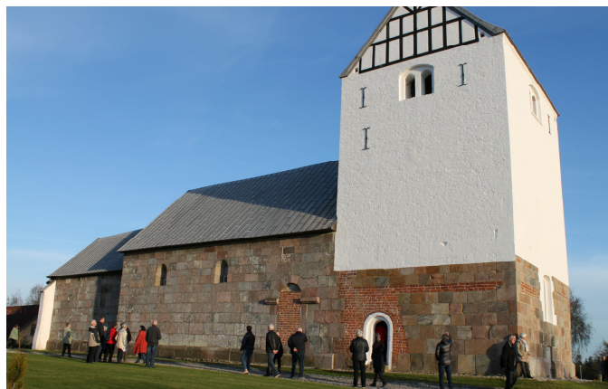
Vesterbølle kirke på en skøn maj aften!